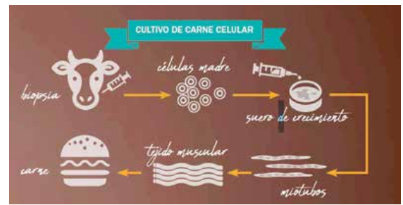
FIGURA 3. CARNE cultivada. Figura tomada de la revista ¿Como ves?, Carne Cultivada. Del laboratorio a tu mesa. A. López Munguía, Año 21, No. 249, agosto 2019.

En 2013 el mundo científico y el consumidor informado tragaron saliva al enterarse que el profesor Mark Post, de la Universidad de Maastricht, presentaba la primera sesión de degustación pública de una hamburguesa preparada con carne producida en el laboratorio