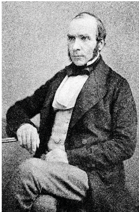
FIGURA 3. JOHN Snow (1813-1858), quien sentó las bases de la epidemiología.

Esta columna se prepara y edita semana con semana, en conjunto con investigadores morelenses convencidos del valor del conocimiento científico para el desarrollo social y económico de Morelos. Desde la Academia de Ciencias de Morelos externamos nuestra preocupación por el vacío que genera la extinción de la Secretaría de Innovación, Ciencia y Tecnología dentro del ecosistema de innovación estatal que se debilita sin la participación del Gobierno del Estado.