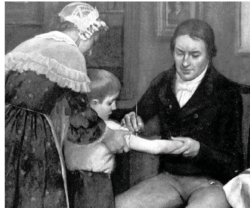
FIGURA 2. EDWARD Jenner (1749-1823), descubridor del principio básico de una vacuna.