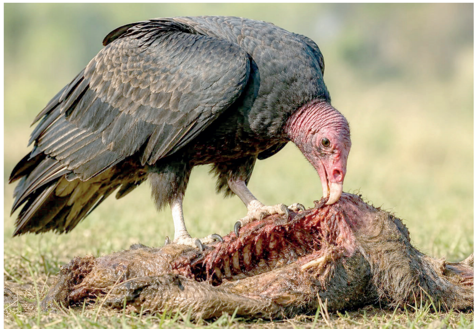
FIGURA 2. IMAGEN generada con inteligencia artificial para ilustrar un zopilote devorando carroña.

Los zopilotes son más pequeños, tienen una altura de hasta 75 cm, una envergadura de hasta 1.70 m y un peso de no más de 3 kilos (Figura 2). En la selva mexicana habita el zopilote Rey, que es sin temor a equivocarse la especie más espectacular: tiene un plumaje blanco y la cabeza desnuda muy colorida. En la mitología maya se le representaba como un dios, que era el mensajero entre los