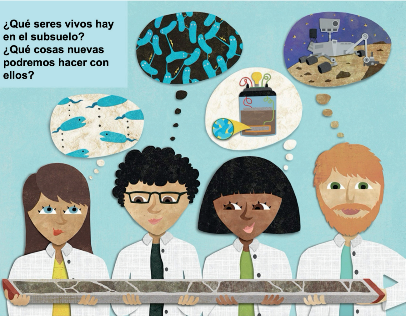
FIGURA 1. Explorando la diversidad en las profundidades de la Tierra.

¿Qué seres vivos hay en el subsuelo? ¿Qué cosas nuevas podremos hacer con ellos?