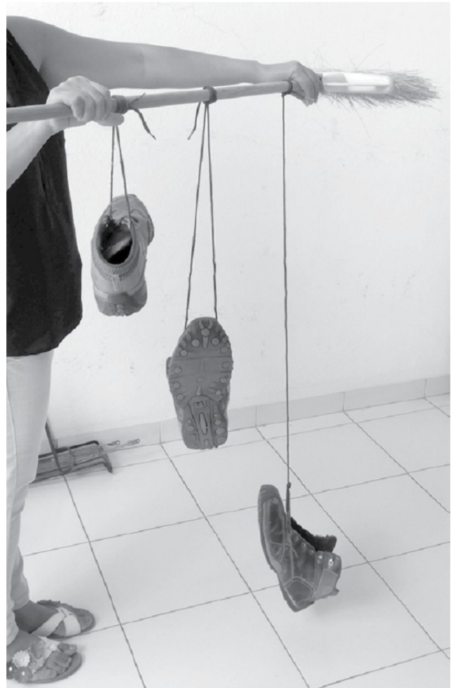
Oscilatrón, formado por algunos zapatos que cuelgan a distintas alturas de un palo de escoba.

Ahora repita los dos pasos anteriores, pero para cada uno de los otros péndulos.