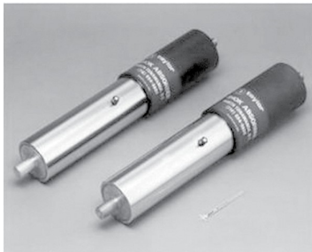
Amortiguador con capacidad de 25 toneladas para abatir daños en edificios durante terremotos.

La transferencia resonante de energía nos permite, por ejemplo, diseñar circuitos electrónicos que pueden entonarse para absorber energía de campos electromagnéticos que oscilen 106.1 millones de veces por segundo, pero que no se vean perturbados cuando la frecuencia sea de 106.9 o cuando sea de 105.3 millones de oscilaciones por segundo. Este circuito nos permitiría escuchar la programación de la estación de radio FM de la Universidad Autónoma del Estado de Morelos, sin la interferencia de Radio Fórmula ni de Radio Capital [ref. 5]. Cuando se rompe la corteza terrestre, o cuando se desplaza una parte de una placa tectónica con respecto a otra, se generan ondas elásticas de varios tipos, ondas primarias y secundarias que se propagan a través del seno de la corteza y ondas de Rayleigh y de Love que se propagan a través de la superficie, y que sentimos como sismos o terremotos. Las ondas primarias son las que más rápidamente se propagan, y corresponden a movimientos longitudinales, en la dirección de propagación de la onda, como las ondas de sonido. Las ondas secundarias llegan poco después y corresponden a movimientos transversales, perpendiculares a la dirección de propagación de las ondas. Las ondas de Rayleigh son movimientos hacia arriba y abajo en la superficie, mientras que las ondas de Love son movimientos hacia un lado y hacia otro [ref. 6]. Todas estas