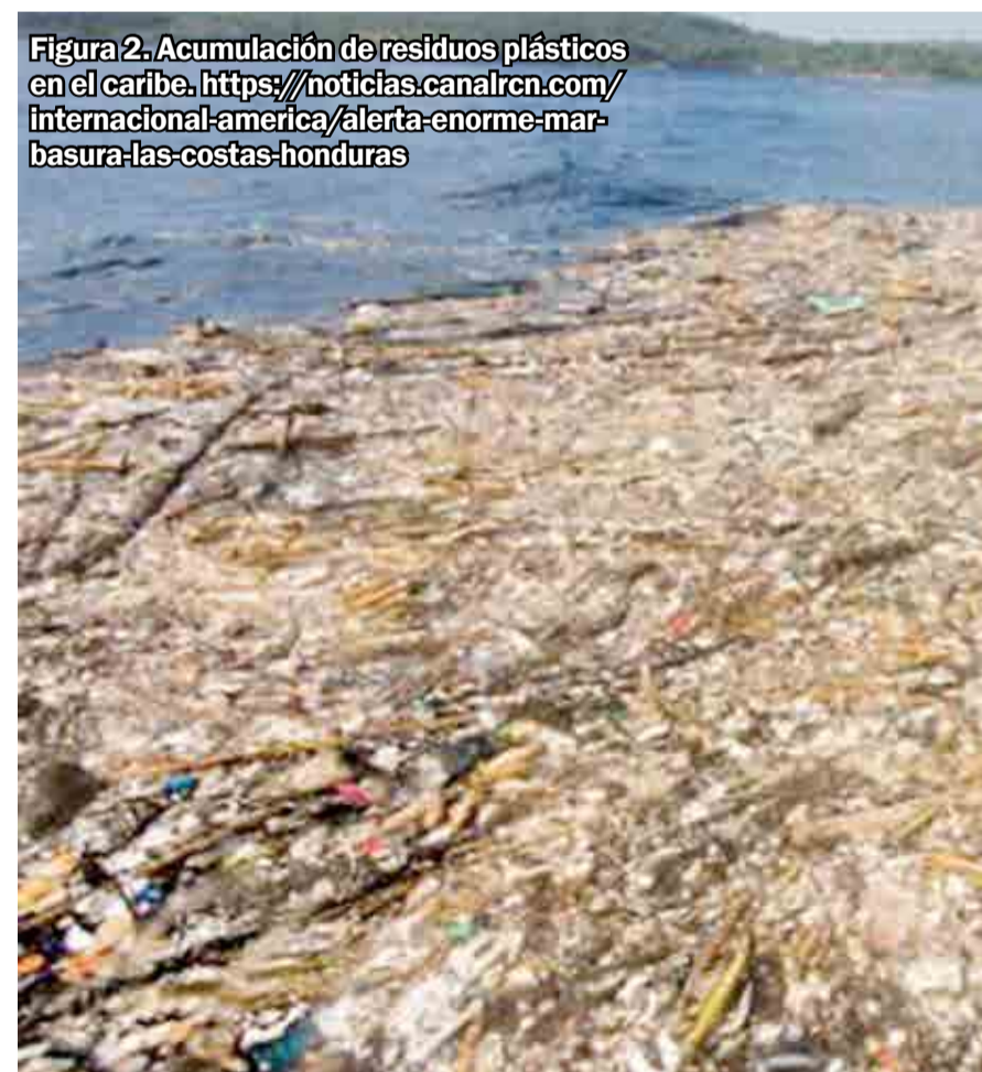
Figura 2. Acumulación de residuos plásticos en el Caribe. https://noticias.canalrcn.com/internacional-america/alerta-enorme-mar-basura-las-costas-honduras

suspensión y se han generado islas gigantes de plástico (Figura 2).