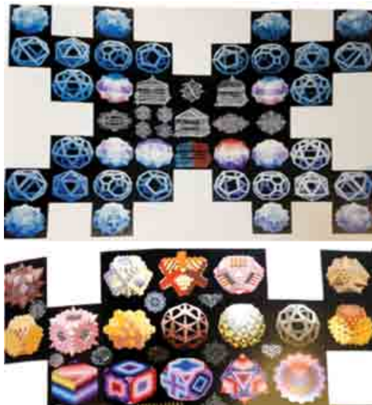
Figura 4. Imagen de una pintura tomada de la exposición Pedro Friedeberg: arquitecto de confusiones impecables, México, 2009.

sin un contexto o posible función. Uno pensaría que son producto de su imaginación y obsesión perfeccionista, sin embargo la forma geométrica de sus objetos es muy