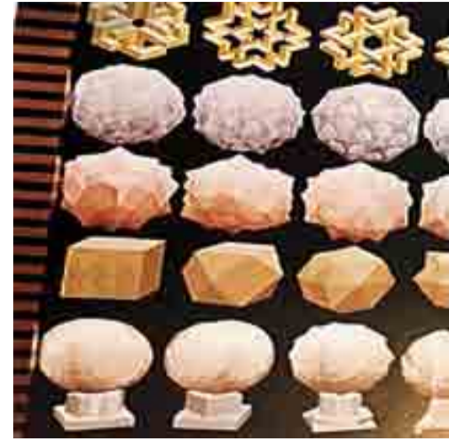
Figura 7 Imagen de una pintura tomada de la exposición Pedro Friedeberg: arquitecto de confusiones impecables, México, 2009.

James Watson y Francis Crick propusieron en 1956, al ver las formas esféricas de los virus obtenidas por microscopía electrónica, que esta apariencia se debía a la capacidad limitada de su genoma para producir proteínas, que daba lugar a que las cápsides se formaran con un costo mínimo de energía y escasos componentes, dando como resultado una construcción repetitiva. Esta propuesta contemplaba interacciones estrechas entre las proteínas que permitían un mejor aislamiento del genoma y que darían lugar a cápsides con una simetría helicoidal o icosaédrica (Figura 6).