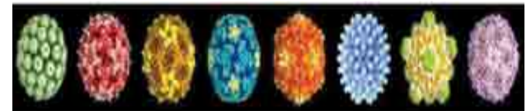
Figura 6. Modelos computacionales de las cápsides de distintos virus.

Las estructuras icosaédricas de las cápsides tienen 20 caras triangulares donde la mínima cantidad de proteínas por cada cara