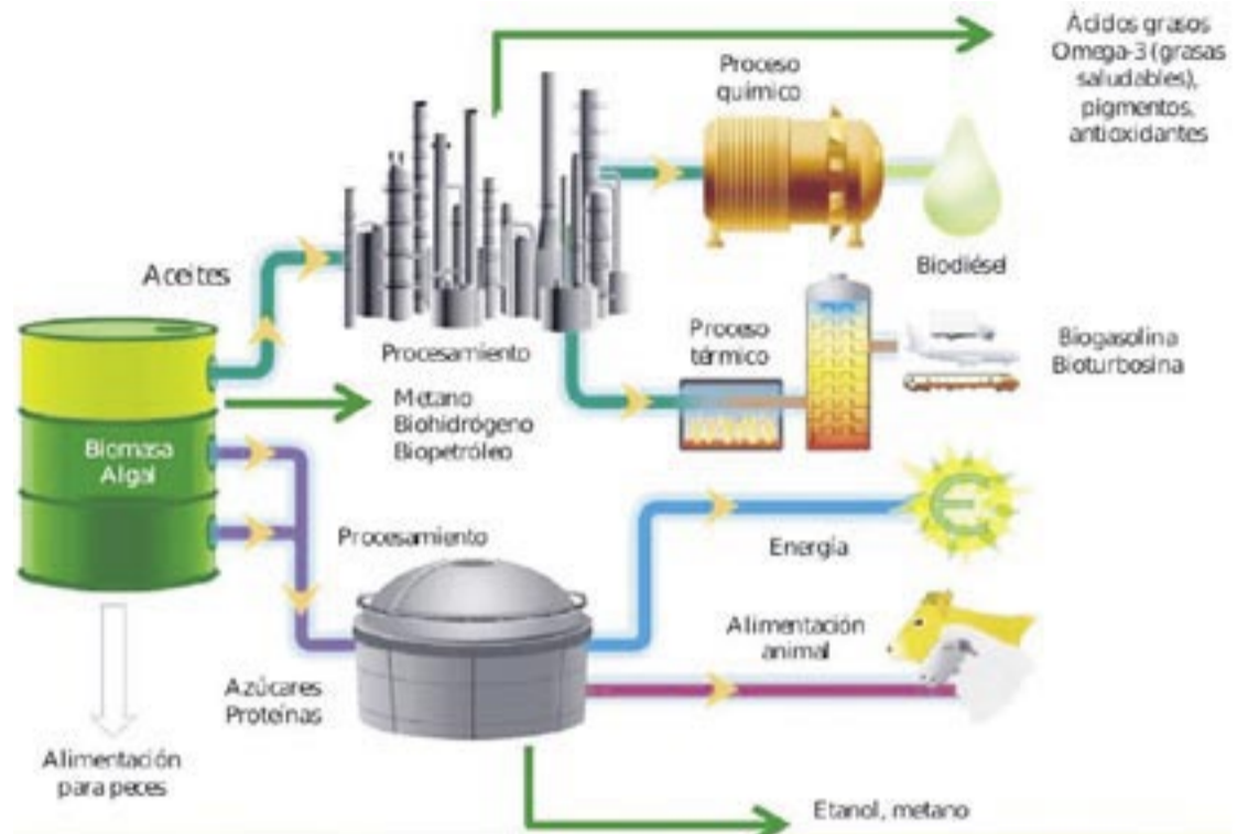
2. Esquema general de procesos para la producción de biocombustibles, ácidos grasos, pigmentos y alimentos para ganado a partir de cultivos microalgales, entre otros. Al concepto de generar varios productos a partir de material biológico, similares a los obtenidos a partir del petróleo en una refinería, se le conoce con el nombre de 'Biorefinería' (Adaptado de Olivares, 2011).

Los organismos fotosintéticos, que necesitan del bióxido de carbono y la luz del sol para poder vivir, crecer y reproducirse, y están presentes en todos los ecosistemas existentes de la tierra, tanto acuáticos como terres-