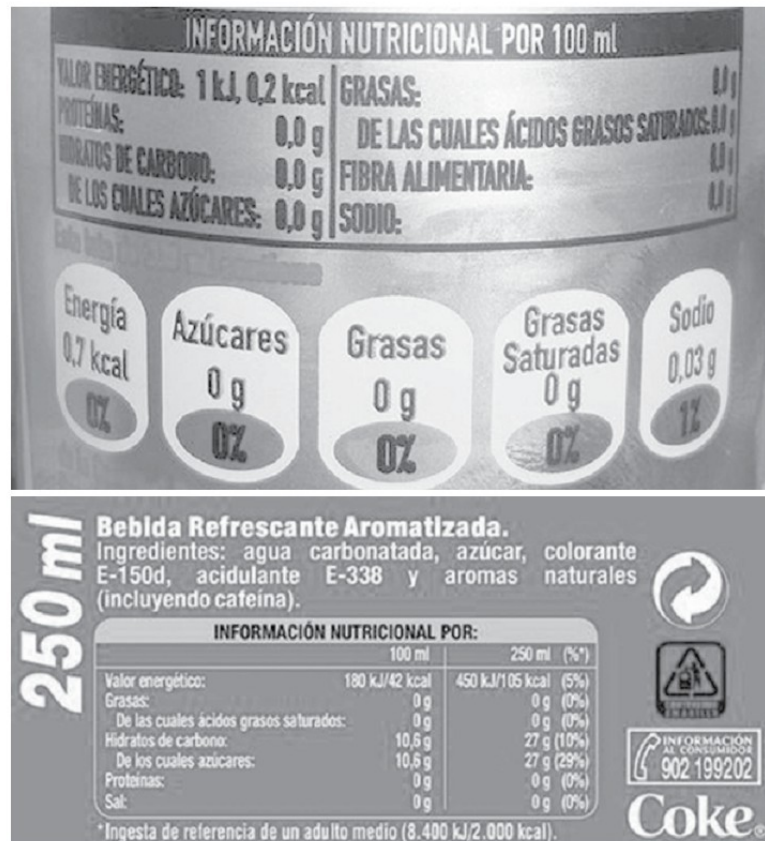
Figura 1. Ejemplos de etiquetas de bebidas light

cional el porcentaje de fructosa utilizada para producir el jarabe de fructosa que posee el producto y sin embargo sabemos que ahí está. Hay estudios que han demostrado que en los refrescos más populares como Coca Cola y Pepsi, la proporción de fructosa en el jarabe usado para endulzar el refresco llega a ser de un 60% por un 40% de glucosa. Un porcentaje que viola la reglamentación en vigor de 42% o 55% máximo. Pero bueno ¿y eso qué?, pues tendemos a pensar que por ser un edulcorante natural no hay peligro de usarlo sin límite. Desgraciadamente se ha demostrado que por más natural que sea no es tan inofensivo como creíamos porque lo natural en exceso también puede causar problemas de salud.