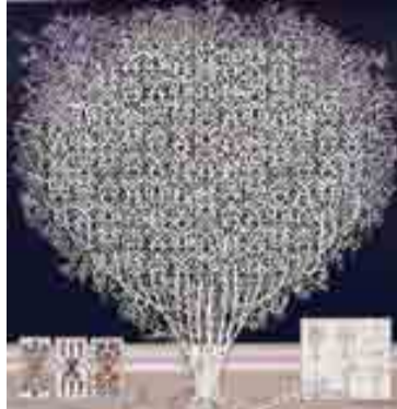
Figura 1 Imágenes de pinturas de Pedro Friedeberg.

está muchas veces íntimamente relacionado con el detallismo,