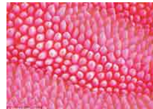
Figura 2. Imagen de un pétalo tomada por microscopía (izquierda) y de un hongo por fotografía (derecha).

Las imágenes a las que se referían Klee y demás artistas de ese momento mostraban simetrías, balances y secuencias rítmicas provenientes de microorganismos, texturas de árboles, y alas de mariposas. Todas ellas hacían ver que hay un grado de ordenamiento matemático en la naturaleza que otorga belleza a las cosas, un tema que también trata el autor Aidan Nichols en el libro Lost in Wonder: EssaysonLiturgy and the Art .