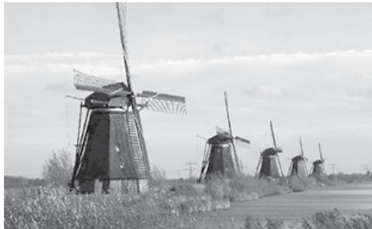
Figura 5. Polders en Kinderdijk, Holanda