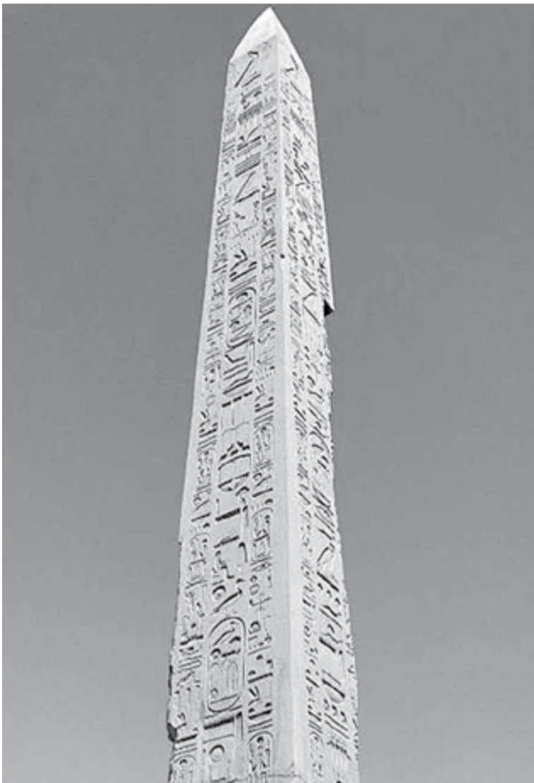
Figura 1. Obelisco de Tutmosis I en Karnak, Egipto.