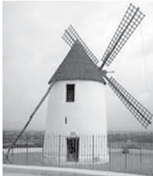
Figura 4: Molino de eje horizontal europeo (izquierda), Molino de eje vertical (Babilonia)

el 59% de la energía cinética contenida en el viento. A pesar de los avances en el uso de la energía eólica de principios del siglo XX, la principal fuente de energía han sido los combustibles fósiles (petróleo y carbón). No fue sino hasta la década de los 70's, como consecuencia de la crisis petrolera, que se consideró nuevamente la opción de las energías renovables, particularmente la energía eólica como una opción de abastecimiento de energía eléctrica.