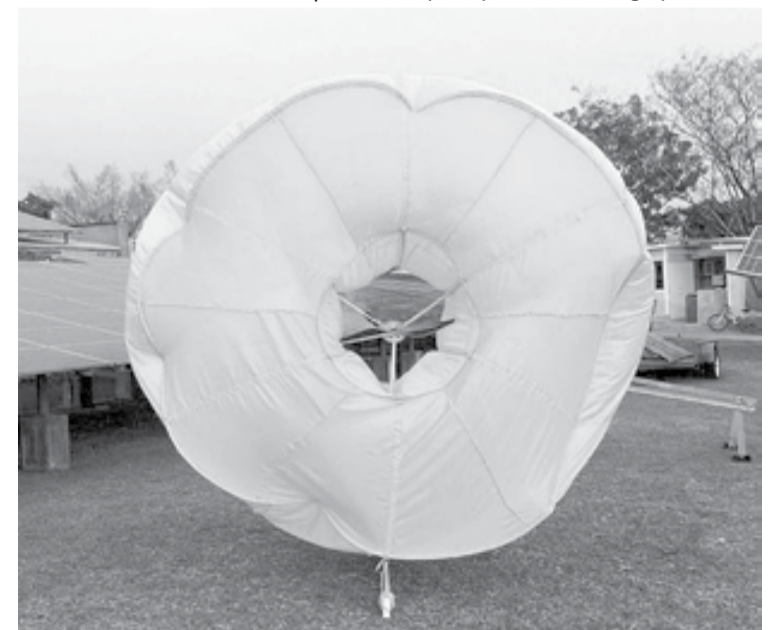
Figura 7. Prototipo de aerogenerador rodeado por globo de gas helio, diseñado por estudiantes de licenciatura del IER-UNAM.

"Secrets in the wind". Bloom, David, Weatherwise. Sep/Oct98, Vol. 51 Issue 5, p14. 6p. 7 Color Photographs