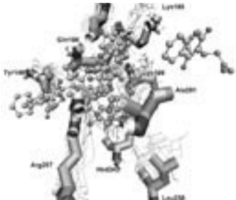
Estructura de la proteína (albúmina) presente en la sangre humana y moléculas (ligandos) con los que interacciona.