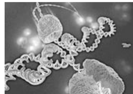
Representación artística de la reparación y duplicación del ADN.

des o el movimiento de grupos específicos de moléculas o, utilizando técnicas capaces de visualizar y manipular moléculas individuales. La Biofísica explica funciones biológicas en términos de mecanismos moleculares: descripciones físicas precisas de cómo moléculas individuales trabajan juntas como pequeñas máquinas para producir funciones biológicas específicas. Inevitablemente la enseñanza y práctica de la Biofísica se circunscriben en tres áreas básicas, a saber: Estructuras moleculares, Técnicas Biofísicas y Mecanismos Biofísicos. Cada una de estas áreas se describe brevemente en los párrafos siguientes.