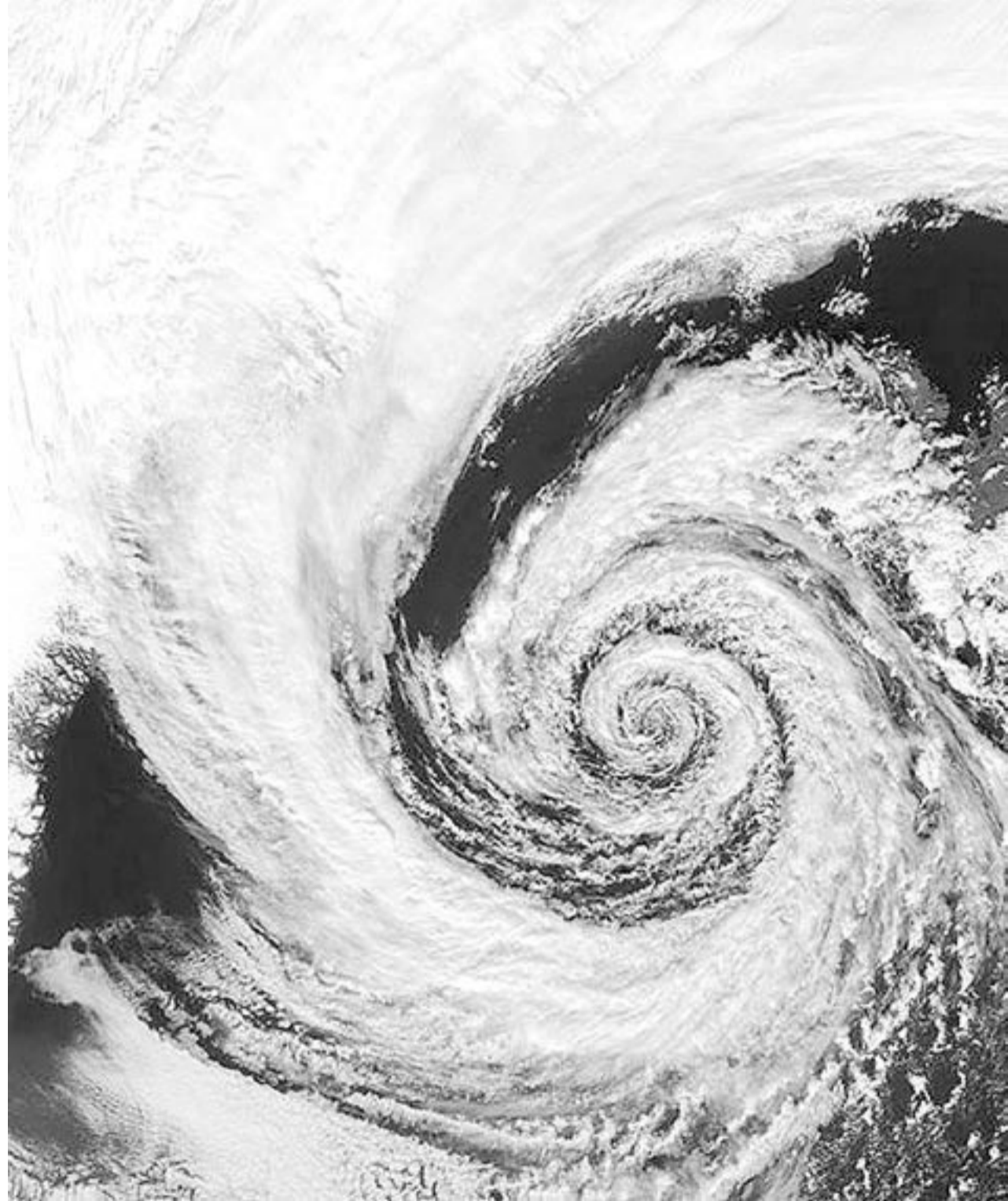
Figura 1. Un huracán sobre Islandia en el hemisferio norte.

Ahora viene un dato que resulta una sorpresa para la mayoría de la gente: el TE vuela realmente muy bajo, ya que orbita la Tierra a sólo 380 millas (608 km) de su superficie. ¿Por qué esto resulta realmente muy bajo? Por la sencilla razón de que el radio de la Tierra es de 6,384 km, lo que significa que la órbita tiene un radio sólo un décimo mayor que el radio terrestre. Así que, si consideramos que el tamaño de la Tierra es el mismo que el tamaño de un limón, el TE estaría volando sobre éste a sólo una altura de la piel del limón! Sin embargo, para lograr mantenerse a esta altura, el TE debe volar a la sorprendente velocidad de 28,286 km/h, o sea 7.86 km/s. Esto corresponde a darle una vuelta completa a la Tierra cada 90 minutos, por lo que los astronautas pueden disfrutar de 16 amaneceres y 16