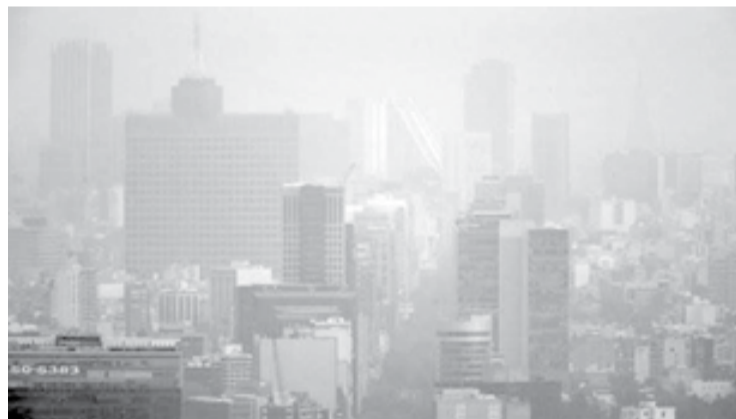
Figura 2. Fotografía de la Cd. de México publicada el jueves 17 de marzo ( http://tmdo.co/22qwbl7 ) mostrando la nula visibilidad debida a la altísima contaminación atmosférica.

vaciones cuidadosas. En el artículo mencionado [ref. 2] se hizo un llamado a medir el consumo global de gasolina en la ciudad, pues ése es un buen indicador correlacionado a la contaminación generada.