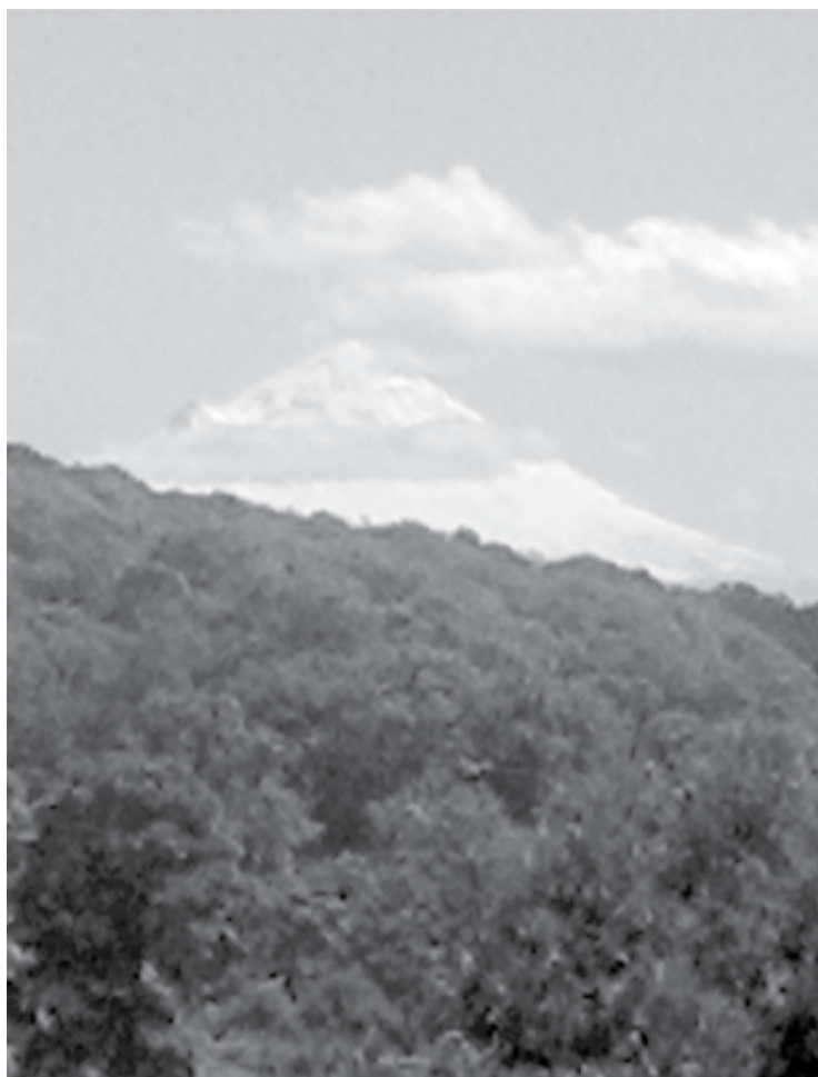
Figura 1. Vista del volcán Popocatepetl desde las instalaciones del Instituto de Ciencias Físicas de la UNAM, fotografiada el viernes 11 de marzo de 2016.

Es importante que los resultados de modelos teóricos sean validados comparándolos con obser-